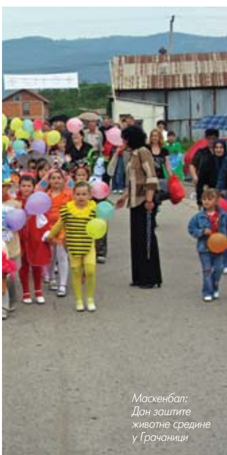
Маскенбал: Дан заштите животне средине у Грачаници

Дом културе у Грачаници има надалеко чувено аматерско позориште (наступа на Космету, али и широм Србије и Републике Српске), културно-уметничко друштво, галерију, биоскоп и значајну издавачку делатност (12 књига у последње три године). У прошлој години одржано је чак 226 програма, што значи да је под сводове Дома културе дошло више од тридесет хиљада људи са простора централног Косова. Најзначајнија, највећа и мултимедијална манифестација „Видовданско песничко причешће“ траје пуних 17 година и за четири недеље окупи на стотине песника, сликара и културних радника, док Грачаничке вечери имају традицију дугу тридесет година. И ове године ће се целог лета одржавати концерти, квизови, наградне игре и други програми.