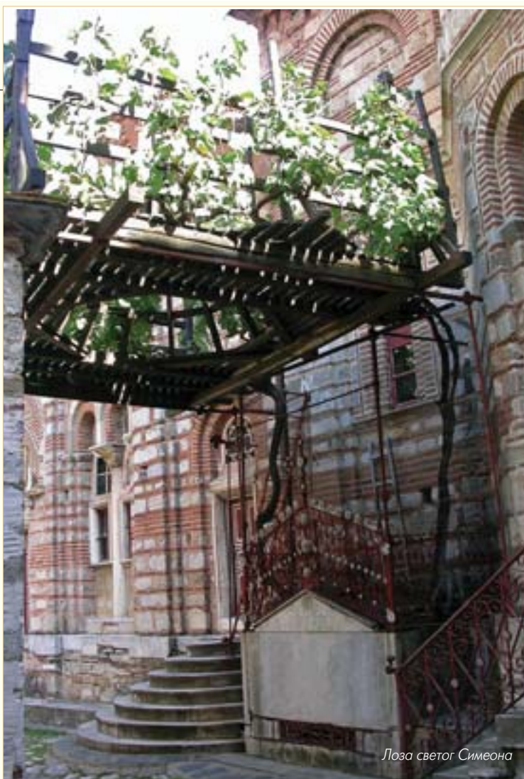
Лоза светог Симеона

Према Конституционалној повељи само тих 20 манастира могу да поседују имовину на Светој Гори, што је, уз специфично демократско устројство, чини јединственом монашком републиком.