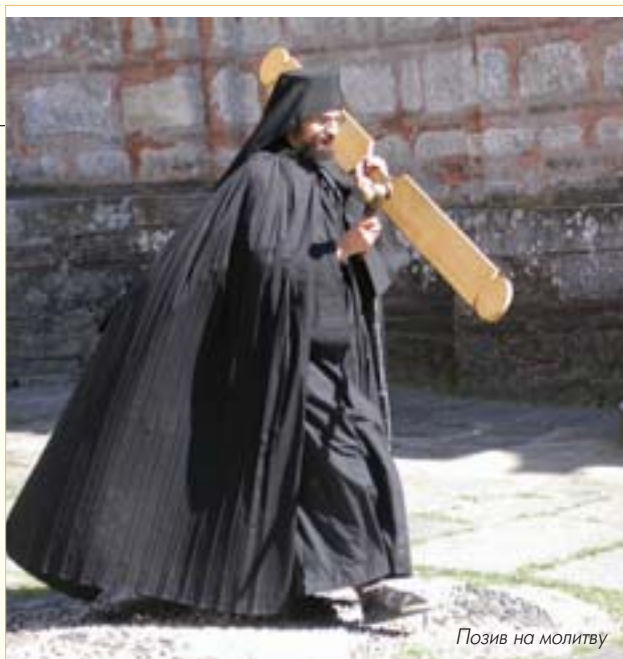
Позив на молитву

Предања, богата чудима која су чинили данашњи светитељи, а негдашњи монаси хиландарски, сведоче о исцелитељској моћи вере Христове. И по томе, манастир Хиландар је један од највећих на Светој Гори. О животу хиландарских монаха, у складу с типиком Савиним, сведочи и костурница у којој се чувају њихове мошти и лобање. Прохујали векови нису им наудили, готово све су беле, што сведочи о богоугодном животу мноштва претходних генерација монаха, док ће молитве