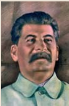
Јосиф Висарионович Стаљин

Тек са настанком државне заједнице Србија и Црна Гора