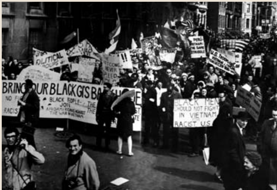
Масовни протести против рата у Вијетнаму крајем шездесетих година у Америци