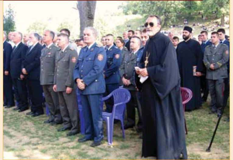
Свечаности у манастиру Крушедол присуствовали су и представници Војне академије