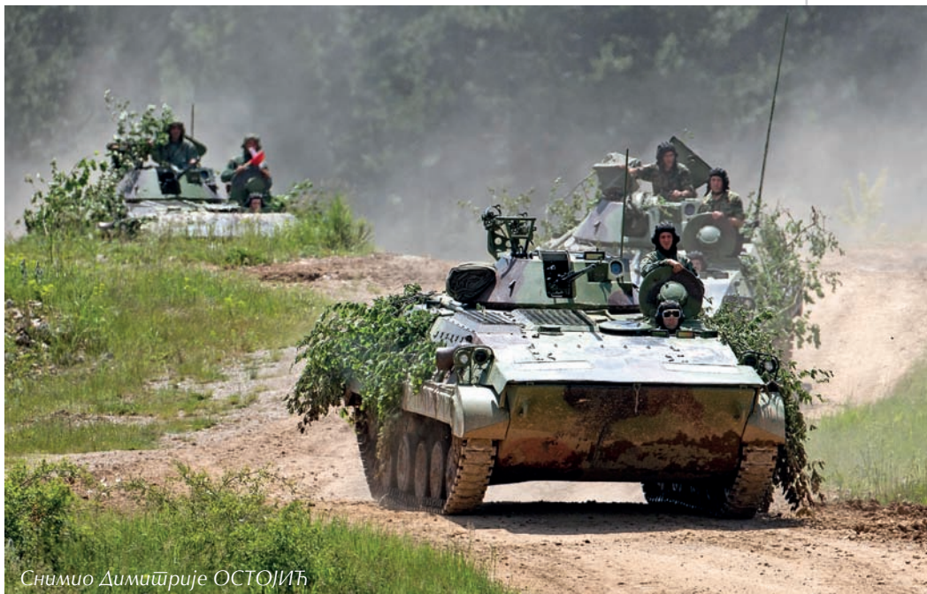
Снимио Димиџрије ОСТОЈИЋ

– Циљ који је Команда Копнене војске поставила за ову вежбу данас, а уклапајући је у вежбу „Морава 2016“, остварен је у потпуности. И нас и вас очекују нови задаци, нова динамика и нови темпо ангажовања на вежби „Морава 2016“. Још једном похваљујем залагање, знање, вештину, руковођење и командовање на овој тактич-