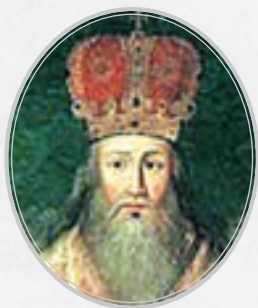
Арсеније III Чарнојевић 1633–1706.

Пећка патријаршија – припојена Охридској архиепископији