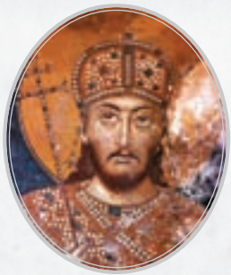
Стефан Урош IV Душан Немањић 1308–1355.