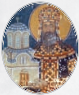
Стефан Урош II Милутин Немањић 1253–1321.