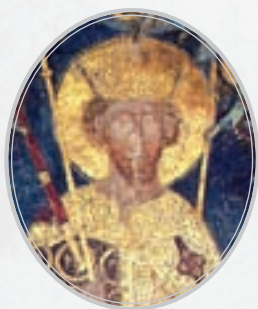
Стефан Урош II Милутин Немањић 1377–1427.

Најважнији закон средњовековне Србије – Душанов законик