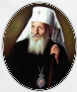
Патријарх српски Павле 1914–2009.

Београдска митрополија постала самостална (аутокефална) црквена област