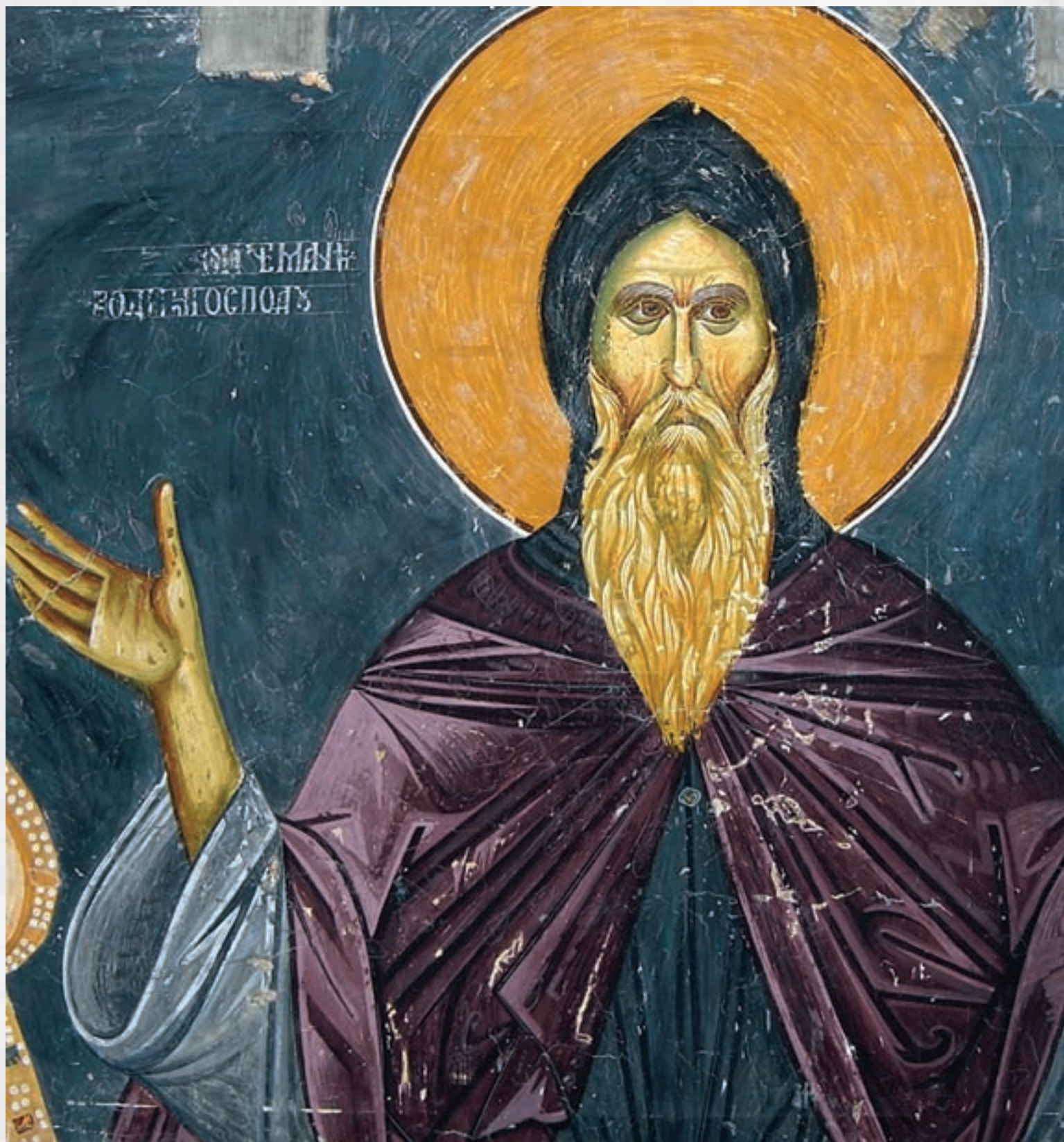
Стефан Немања, фреска из Богородице Љевишке (почетак XIV века)