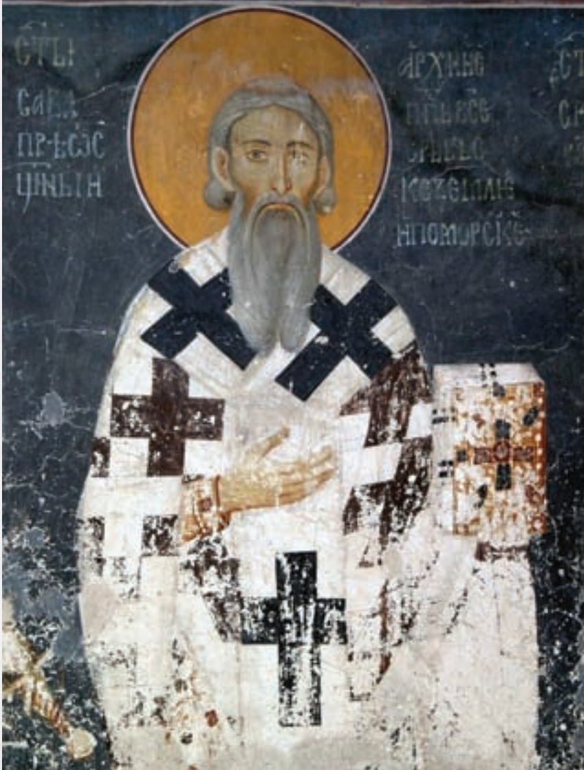
Свети Сава I Немањић Српски , фреска из манастира Студеница из 1314.

чу на њену спољну политику. У том бурном времену, испуњеном крупним политичким превирањима и променама на Балкану, ратови су били незаобилазни. Искористивши унутрашње сукобе у Бугарској, као и оне између Бугарске и Латинског царства, Стефан Немањић је 1208. године успео да прошири државу коју му је отац оставио у наслеђе. Освојио је градове и области око Ниша, Врања, Липљана, Призрена, Биничке Мораве, успоставивши тако јужну границу Србије на Шар-планини. Водио је ратове против Бугарског и Латинског царства и епирског деспота, а дипломатском мудрошћу успео је да осујети планирани напад Угарске са севера и тиме, бар за из-