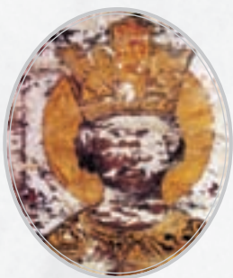
Ђурађ Вуковић Бранковић 1377–1456.