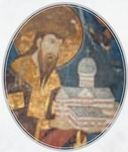
Стефан Урош III Немањић 1276–1331.