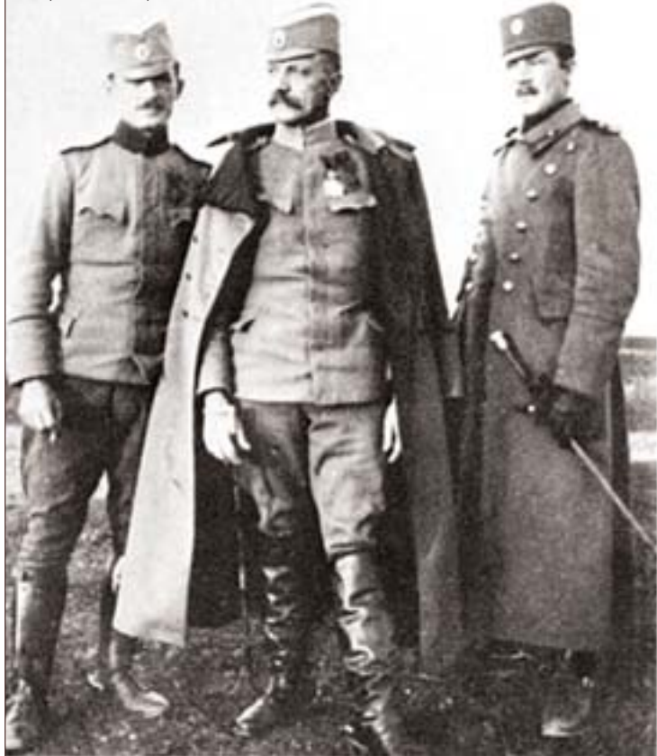
Војвода Живојин Мишић са синовима

свет у нове сукобе. То је период који професор Андреј Митровић сликовито назива „време нетрпељивих“.