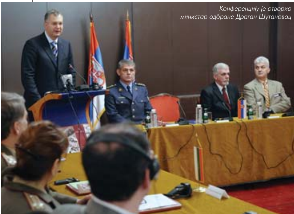
Конференцију је отворио министар одбране Драган Шутановац

Стратегијска искуства српске војске из Првог светског рата на страницама часописа „Ратник“